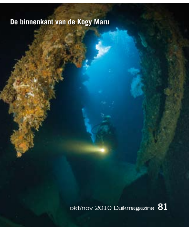
De binnenkant van de Kogy Maru

die wellicht door Amerikaanse bommen zijn gemaakt. We gaan via een van de gaten naar binnen; het schijnt dat ook hier de machinekamer nog behoorlijk intact is. Op 38 meter diepte komen we aan in een fascinerende ruimte met tal van trapjes, touwen, afsluiters en andere onbekende onderdelen, die door de combinatie van diepte, donkerte en krapte als een behoorlijk sinister geheel op ons inwerkt. We nemen wat foto's en verlaten via een ander gat het wrak om onze duik op het dek, via grote platen verwrongen staal te vervolgen. Opvallend is de enorme hoeveelheid zwart koraal op het schip. We zwemmen richting de voorsteven van het schip. Daar staan de restanten van de geschutskoepels. Een enorme school horsmakrelen cirkelt eromheen. Ondanks dat we met Nitrox 32 duiken, begint de nultijd aardig dichtbij te komen en we besluiten op te stijgen.