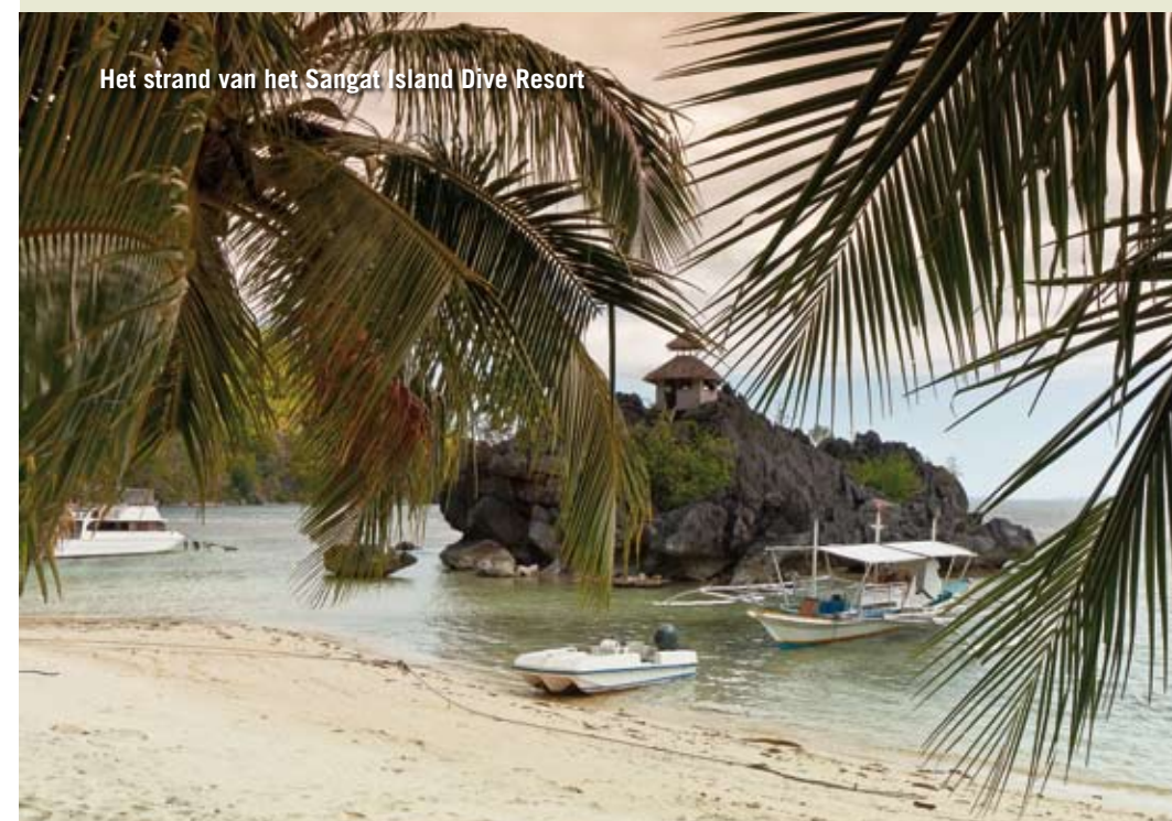
Het strand van het Sangat Island Dive Resort