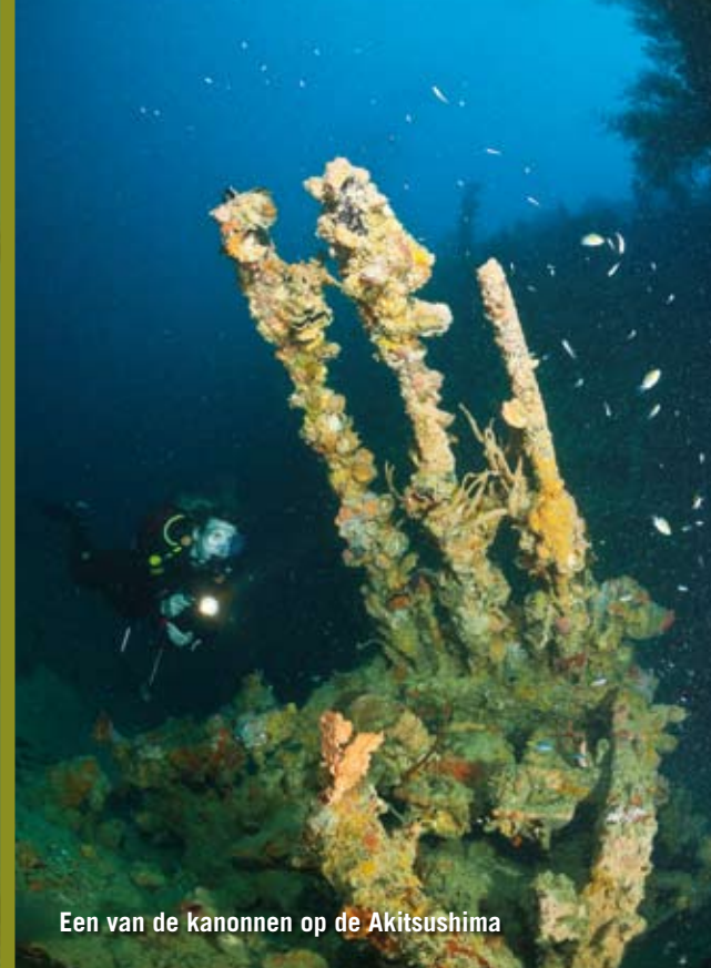
Een van de kanonnen op de Akitsushima

gangen langs de doorgescheurde scheepsromp en door de patrijspoorten boven ons schijnt zonlicht naar binnen wat een prachtig effect geeft. Na enkele doorgangen komen we aan in de machineruimte waar we enorme tandwielen zien die waarschijnlijk bedoeld waren voor de aandrijving van de kraan. We zwemmen verder en in het midden komen we er aan de onderkant weer uit. Hier staat een stevige stroming en we besluiten er niet tegenin te zwemmen maar aan de luwe zijde, langs allerlei met koraal begroeide overhangende afgescheurde stukken staal, het wrak te verlaten richting het touw, waarlangs we weer gaan opstijgen.