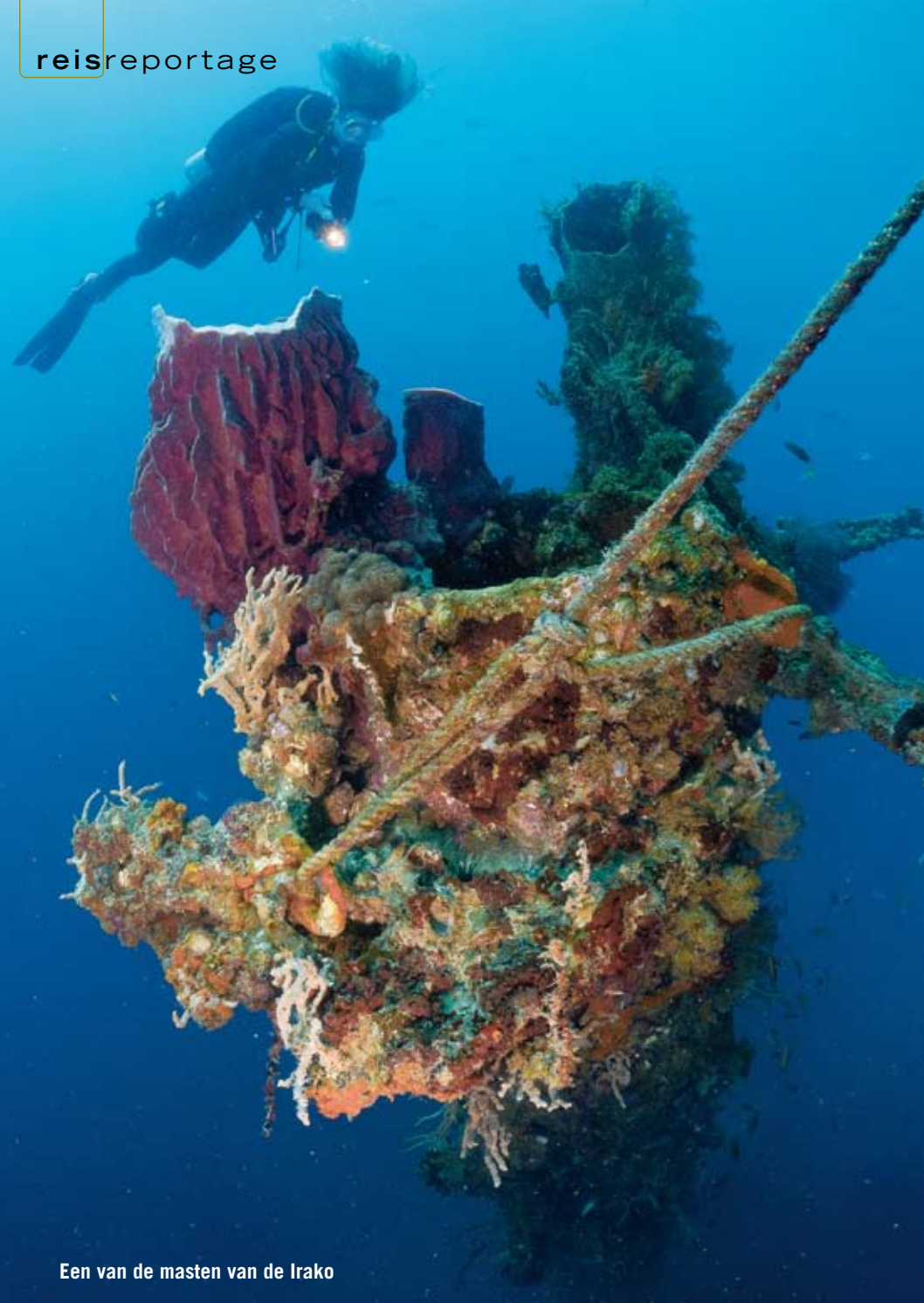
Een van de masten van de Irako