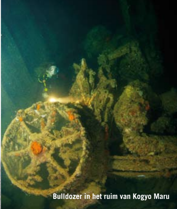
Bulldozer in het ruim van Kogyo Maru