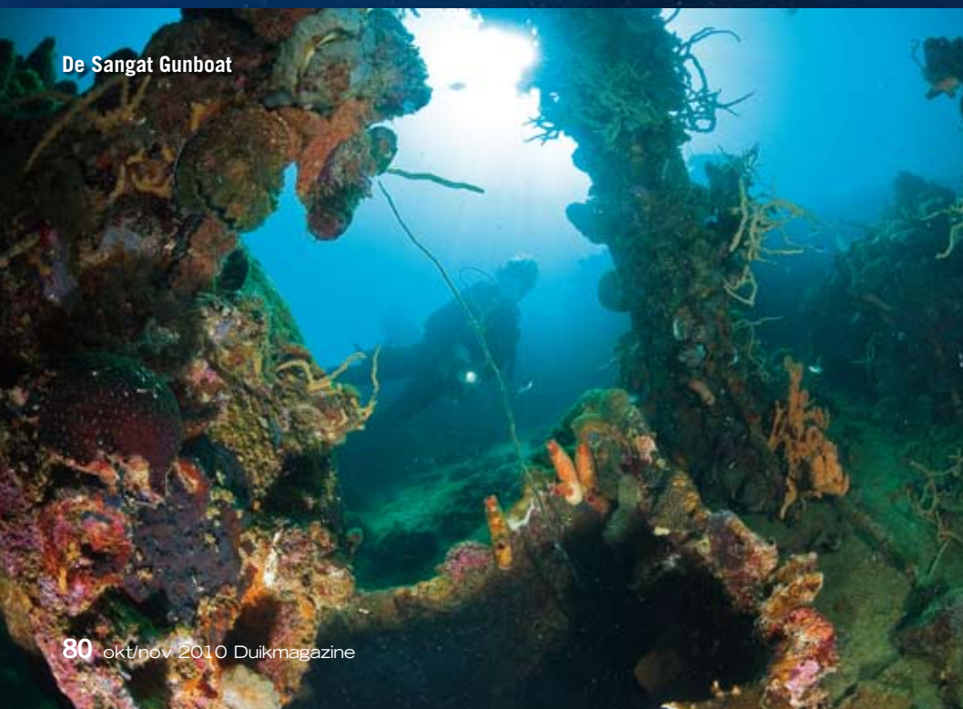
De Sangat Gunboat