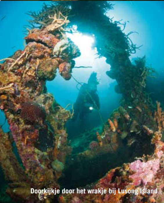
Doorkijkje door het wrakje bij Lusong Island