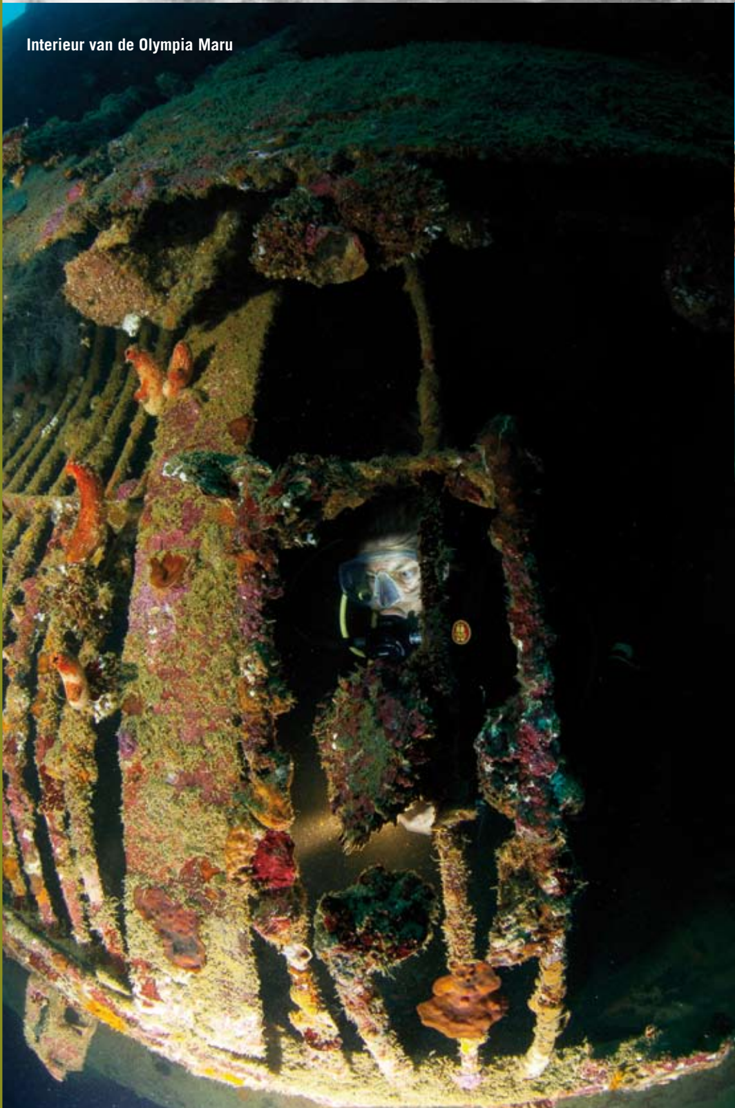
Interieur van de Olympia Maru