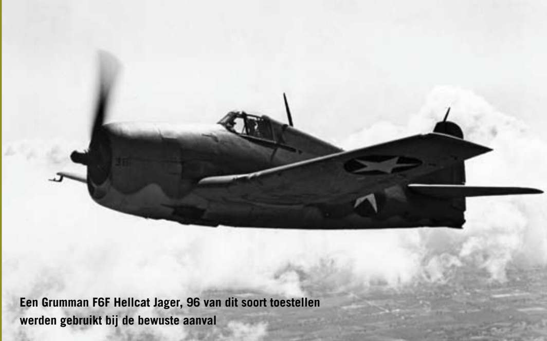
Een Grumman F6F Hellcat Jager, 96 van dit soort toestellen werden gebruikt bij de bewuste aanval

En dan op 24 september 1944 is het zover. Rond negen uur 's ochtends komen de Amerikaanse vliegtuigen aan bij hun Japanse doelen die daar voor anker liggen. De eerste schepen die werden aangevallen, waren de Akitsushima en de Okikawa Maru . De Akitsushima was de grootste bedreiging, want het was een zwaar gepantserd en