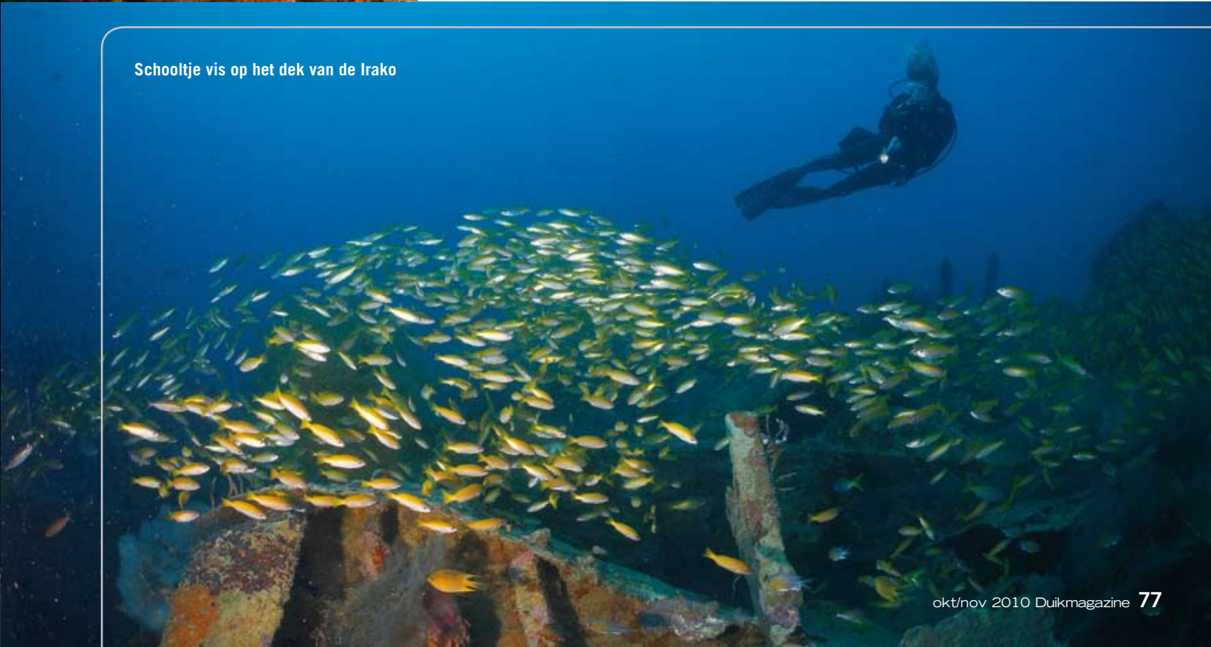
Schooltje vis op het dek van de Irako

bewapend oorlogsschip dat vliegtuigen transporteerde en zodoende nog aardig weerstand kon bieden. Het was dus zaak haar zo goed mogelijk te raken en dat lukte: Door middel van precisiebombardementen sloeg er een bom in aan bakboordzijde, waarna er een explosie volgde, het schip slagzij maakte en zonk. De nabijgelegen Okikawa Maru , een olietanker, werd ook geraakt, maar zonk niet direct. Na de aanval dreef zij brandend en zwaar beschadigd, min of meer stuurloos naar het noorden en het duurde nog tot 9 oktober voor zij zonk nadat een Amerikaanse jager haar tijdens een tweede aanval de genadeslag toebracht.