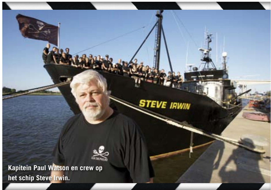
Kapitein Paul Watson en crew op het schip Steve Irwin.

Begin 2009 liepen de gemoederen op de Antarctische Oceaan hoog op en het schip Steve Irwin kwam in aanvaring met de Japanse walvisvaarder Yushin Maru 2. Daarop dienden de Japanners een aanklacht in bij de vlagstaat Nederland. Minister-President Jan-Peter Balkenende sprak er schande van en beloofde de registratie ongedaan te maken. Het is echter nooit zover gekomen. Sterker nog, sinds kort vaart ook het schip Bob Barker onder de Nederlandse vlag.