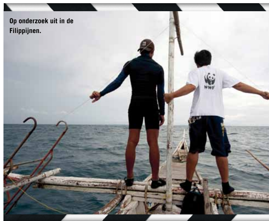
Op onderzoek uit in de Filippijnen.

"Ik deel de mening dat een paar van de certificeringen niet terecht zijn. Het gaat om een paar procent van alle certificeringen en ik vind niet dat we daarom het kind met het badwater moeten weggooiden. Dit is momenteel het enige instrument waarmee we iets