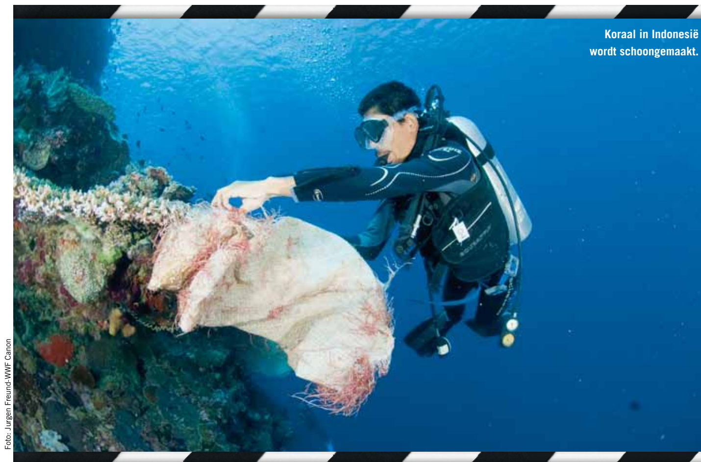
Koraal in Indonesië wordt schoongemaakt.

sommige vissers nog niet helemaal. Je kunt beter subsidies geven op goede kraamkamers dan op dure dieselolie: als je lokale visstand op peil is, hoef je ook niet meer zo ver te varen." □