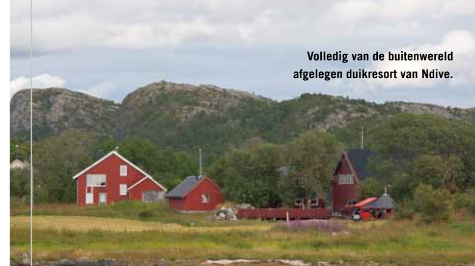
Volledig van de buitenwereld afgelegen duikresort van Ndive.

Voordat we terug gaan, moeten we nog een kort duikje maken in een lange maalstroom, waar ooit door een stel Finnen een stromingsduik van 1,7 kilometer is gemaakt. Het is een stromingsduik die behoorlijke snelheden bereikt, maar ongevaarlijk is, omdat het nergens dieper is dan twaalf meter. Desondanks blijkt dat voldoende diepte om de duikcomputer op hol te laten slaan. Leuk en mooi is het wel. In de getijdenstromingsduiken bij Strømsholmen waren alle wanden begroeid met dodemansduimen. Hier zie je die nauwelijks, want de anjelieren hebben de strijd om een vestigingsplaats gewonnen en hoe: alles is bezaaid met anjelieren zowel links,